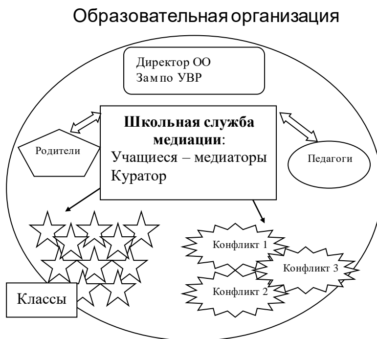
Рисунок №1. Структура «Школьной службы медиации» в ОО города

«Школьная служба медиации» создается в образовательной организации на основании приказа директора ОО и локального акта «Положения о школьной службе медиации», утвержденного решением педсовета ОО. В городе Дзержинске «Школьные службы медиации» с 2018 года созданы во всех ОО.